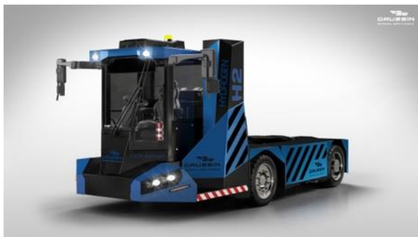
L'ATM@ destiné aux opérations logistiques