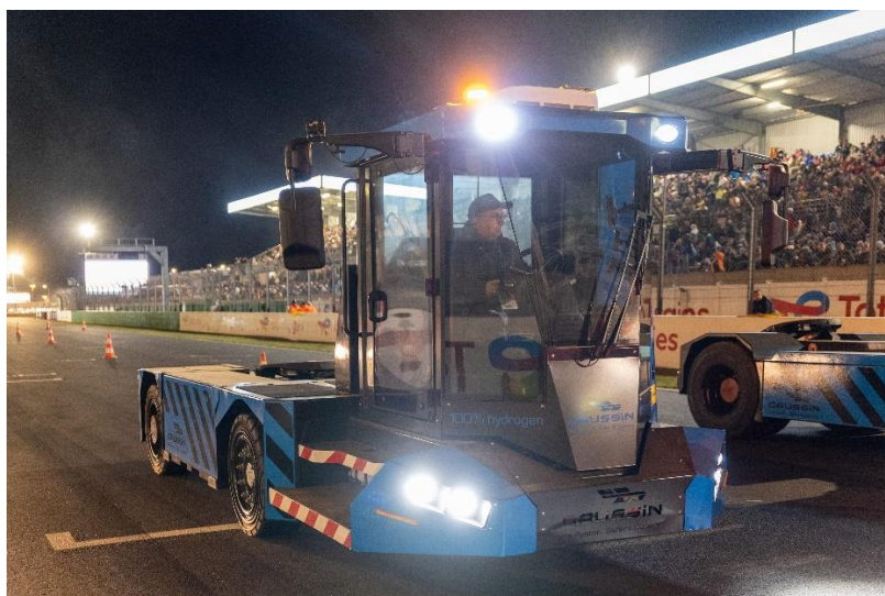
L'ATM® de GAUSSIN défilant lors des 24h du Mans Camions en septembre 2022